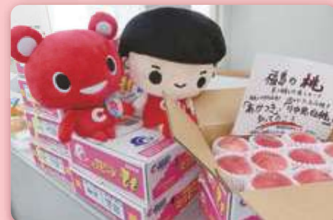
震災・原発事故の影響を肌で感じた 被災地視察・交流ツアー

今年の3月11日で、東日本大震災の発生から10年が経ちます。この間続けてきた被災地視察や子ども保養プロジェクトなどの復興支援の取組みを通して、私たちはたくさんの人と出会い、さまざまなことを学びました。被災地の想い、組合員の皆さんの想いと一緒に、10年の取組みを振り返ります。(特集)