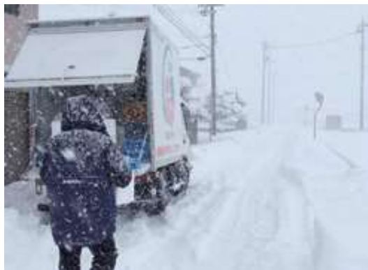
1月8日(金)時点での積雪と配送の様子。8日は日中の短時間で積雪が大幅に増え、配送時間が遅延し、一部のお届けを断念せざるを得なくなりました。

そのため、近隣の地域包括支援センターや県内の福祉事業所などに呼びかけ、皆様にお届けできなかった商品を無償で提供させていただきました。